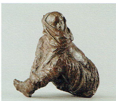
本郷新《無辜の民 砂漠の女》1970年