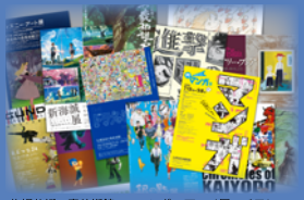
札幌芸術の森美術館でのマンガ・アニメ展のチラシ

最近、美術館でマンガやアニメに関する展覧会が増えたと思いませんか。そこにはどのような意味があり、課題があるのでしょうか。 当館館長が札幌芸術の森美術館学芸員時代に関わった事例を中心に、紐解いていきます。